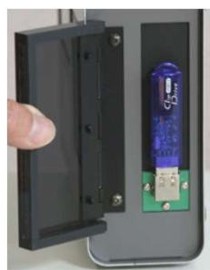
USBメモリ の取り付け