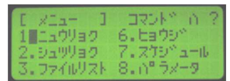
【バックライト付液晶ディスプレイ】

! フォルダおよびNCデータの名前は英数のみで作成下さい。 P-530は漢字・カナ表記には対応していません。(USB読込時)