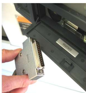
NC機のRS232C ポートへ接続する